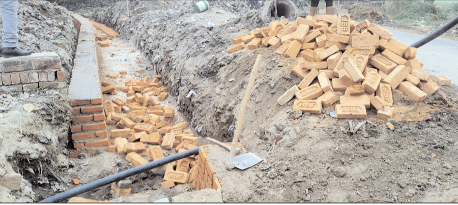
न्यूज गाइड। संवाददाता

शिवगढ़,रायबरेली। क्षेत्र के भवानीगढ़ - बहुदाखुर्द सम्पर्क मार्ग पर स्थित बेड़ार में सड़क के किनारे