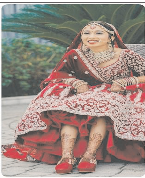
आप छोटी हील्स ही पहनें तो अच्छा है।

तो पहनने में भी बहुत कंफर्टेबल होती हैं। अगर आपकी हाइट लंबी है तो