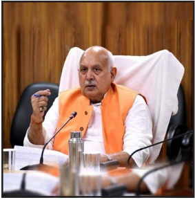
राज्यों तथा विदेशों में बेचकर अच्छा मूल्य दिलाया जायेगा। उन्होंने कहा कि प्रधानमंत्री की प्रेरणा से योगी आदित्यनाथ की सरकार ने चार पैक हाउस (लखनऊ, सीतापुर, अमरोहा, वाराणसी) तैयार किये जा रहे हैं। गत वर्ष 2021-23 में 1 लाख 59 हजार 344 मीटन (लगभग 161 करोड़ रुपये का) निर्यात किया गया

लखनऊ। आज सीजन में पहली बार लखनऊ से दुबई के लिए सब्जियों का पहला कन्सैडन्मेंट एयर इण्डिया की फ्लाइट से भेजा गया है। इसमें 3 टन भिंडी, 1 टन गाजर, 800 किलो मटर शामिल हैं। जल्द ही गाजर, मटर, मिर्च का भी निर्यात अरब देशों सहित यूरोप के लिए भी किया जायेगा। यह भी सुनिश्चित किया गया है कि लखनऊ से हर हफ्ते चार कन्सैडन्मेंट भेजे जाएंगे। यह बात आज प्रदेश के कृषि मंत्री सूर्य प्रताप शाही ने सचिवालय स्थित अपने कार्यालय में मीडिया प्रतिनिधियों के सम्मुख कही। उन्होंने कहा कि प्रदेश के किसानों के गुणवत्तापूर्ण उत्पादों को देश के अन्य