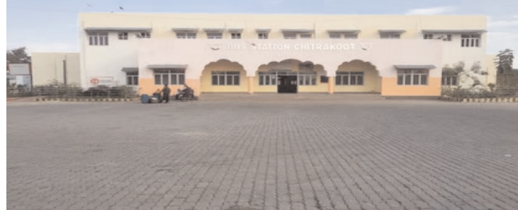
अभी तक बांदा डिपो से हो रहा है। डिपो का दर्जा मिलने के बाद वहां पर एआरएम व स्टाफ बैठेगा

बांदा(यूपैनएस)। चित्रकूट के राजकीय बस स्टैंड को डिपो का दर्जा मिलेगा। 20 दिसंबर को परिवहन मंत्री दयाशंकर सिंह इसका उद्घाटन कर सकते हैं। परिवहन विभाग इसकी तैयारियां कर रहा है। बांदा डिपो से रोडवेज की 10 बसों को चित्रकूट डिपो भेजने की तैयारी है। विभाग इन बसों के संचालन के लिए रूट चार्ट बना रहा है। चित्रकूट डिपो से रोडवेज बसों का संचालन शुरू होने से कानपुर और लखनऊ जाने वाले यात्रियों को अन्य रूट से बसें जाने पर 10 किलोमीटर की दूरी कम पड़ेगी।चित्रकूट में बस अड्डे का संचालन